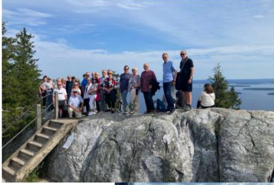
Matkaajat Kolin kansallismaisemassa