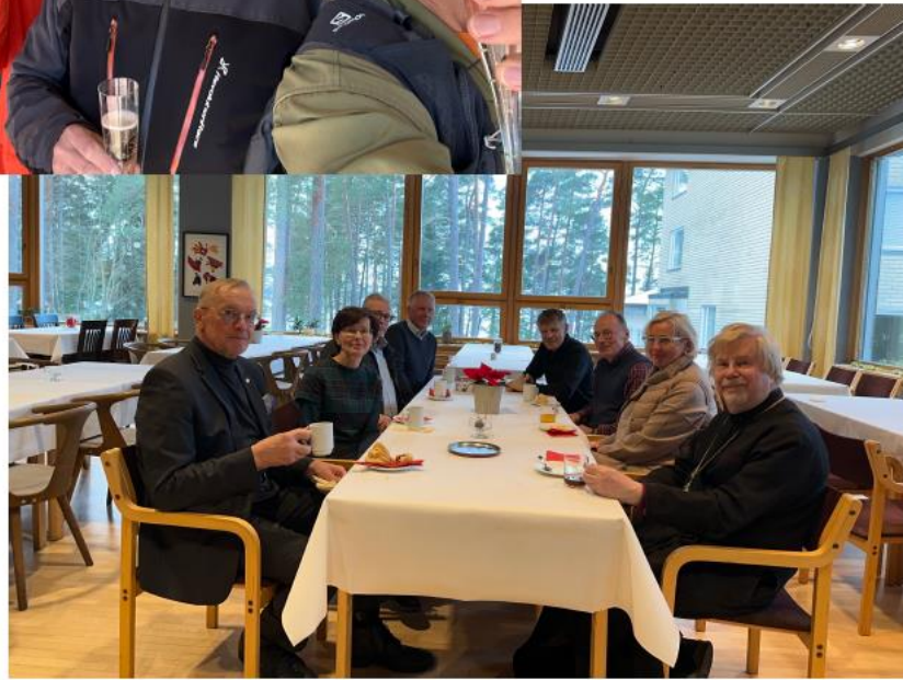
Teams webinaari entiseltä OP-Opistolta