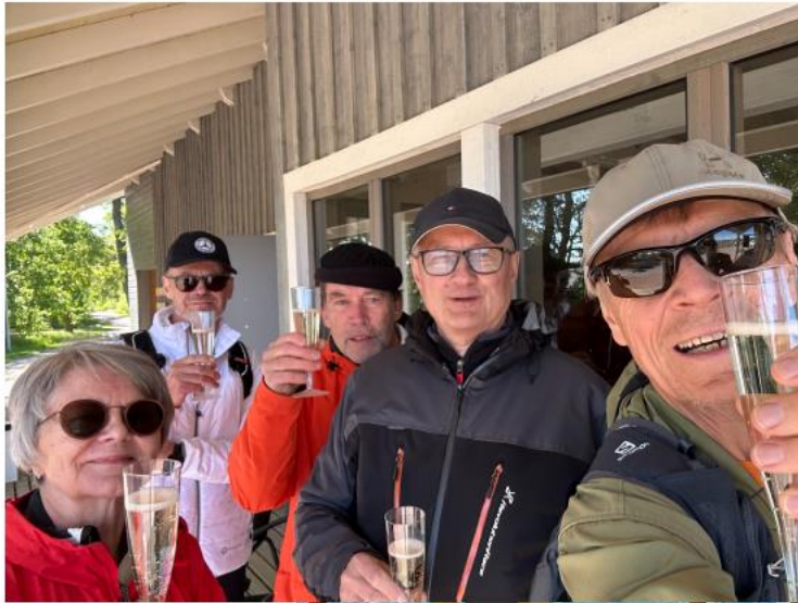
Tervetuliaismaljat yllättää Örossa