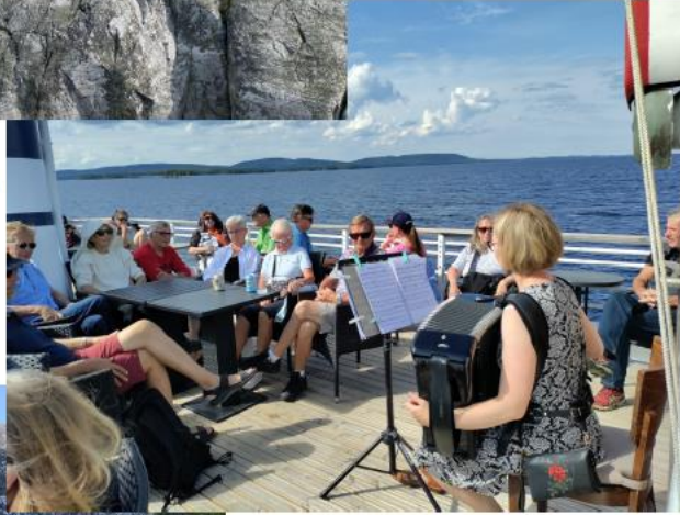
Kesäpäiväki ylittää Pielistä